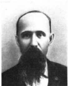
K. G. FORMING